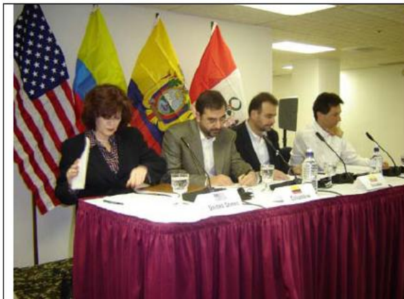
Sexta Ronda del TLC. Rueda de prensa, Tucson, Estados Unidos, noviembre de 2004.

Además de los temas mencionados, que corresponden de forma específica al comercio de productos industriales, agropecuarios y servicios, el TLC contiene otras disciplinas relacionadas directamente con el acceso a mercados y que se aplican al comercio de mercancías. Se trata de los obstáculos técnicos al comercio, las reglas de origen, los procedimientos aduaneros y las salvaguardias.