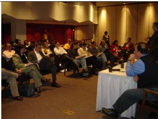
Octava Ronda del TLC. Sesión del Cuarto de al lado en el BID, Washington, Estados Unidos, marzo de 2005.

El TLC crea un margen de seguridad para los empresarios en relación con la competencia en los mercados. Difícilmente se enfrentará un empresario a la conformación de monopolios en su sector de actividad, que restrinjan su presencia en el mercado.