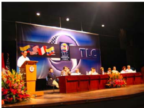
Primera Ronda del TLC. Instalación, Cartagena, 18 de mayo de 2004.

estamos ganando una herramienta muy importante para ganar competitividad y para conquistar mercados antes de que países como China e India lo hagan.