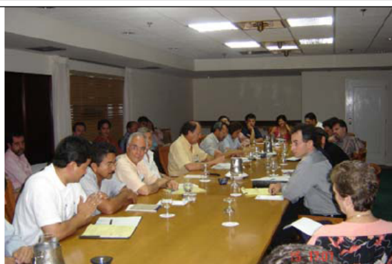
Cuarta Ronda del TLC. Reunión de Parlamentarios colombianos con negociadores de Estados Unidos, Fajardo, Puerto Rico, septiembre de 2004.

Los objetivos de Colombia en la negociación de bienes industriales se orientaron a obtener acceso preferencial permanente para todas las exportaciones del sector, que vienen registrado una dinámica notable en los años recientes y son importantes generadores de valor agregado en la economía; definir reglas de juego claras en el comercio de bienes industriales entre los dos países; y establecer condiciones adecuadas de transición para el ingreso de productos industriales de los Estados Unidos a Colombia. Se buscó generar condiciones propicias para impulsar la exportación de nuevas manufacturas.