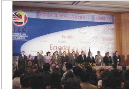
Décima Ronda del TLC. Instalación, Guayaquil, Ecuador, junio de 2005.

El capítulo de Medio Ambiente trata dos elementos principales: la adopción de unas obligaciones en materia de protección al medio ambiente y la definición de unos elementos de cooperación entre las partes que faciliten el cumplimiento de esas obligaciones. Tal como se consagra en el Capítulo, la obligación fundamental, para todos los participantes en el Tratado, consiste en hacer cumplir su propia legislación nacional en materia ambiental.