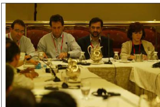
Novena Ronda del TLC. Reunión de jefes negociadores, Lima, Perú, abril de 2005.

El capítulo de Asuntos laborales del TLC tanto Estados Unidos como Colombia se comprometen a cumplir su propia legislación laboral y a respetar los derechos fundamentales de los trabajadores, internacionalmente reconocidos mediante los acuerdos de la Organización Internacional del Trabajo – OIT-.