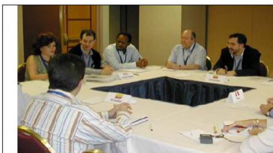
Segunda Ronda del TLC. Mesa de jefes, junio de 2004, Atlanta, Estados Unidos.

Los aspectos institucionales del Tratado abarcan declaraciones de tipo político y los mecanismos de administración del Tratado; y están contenidos en el preámbulo, y los capítulos disposiciones generales, administración, solución de controversias y disposiciones finales.