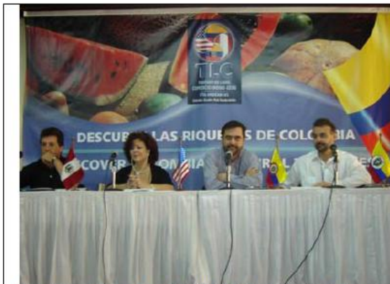
Séptima Ronda del TLC. Rueda de Prensa, Cartagena, febrero de 2005.

Además de los aspectos institucionales y de aquellos orientados a crear las condiciones para el acceso real a los mercados bajo condiciones preferenciales permanentes, el TLC incluye varios capítulos que refuerzan las disciplinas y la estabilidad en las reglas de juego para los empresarios en diferentes campos; se trata de los capítulos de Propiedad intelectual, Política de Competencia, Asuntos laborales y Asuntos ambientales.