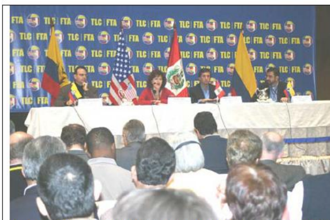
Tercera Ronda del TLC. Rueda de Prensa, Julio 26 de 2004, Lima, Perú.

El objetivo central de Colombia era garantizar que la agricultura nacional quedara como ganadora neta, de suerte que el balance de la negociación fuera la resultante entre las necesidades de exportación de productos agropecuarios y la protección razonable de la producción nacional que pudiese verse afectada por la competencia estadounidense.