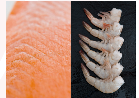
[신선한 연어와 새우]

수산제품은 1년 사계절 상시 공급이 가능합니다. 동맹국들의 수산업의 고(高)생산성과 경쟁력은 연구개발, 혁신, 기술개발, 품질, 및 위생관리 등에 힘입어 높은 명성을 자랑합니다. 그 중 주요 수산물품은 작은 새우, 큰 새우, 연어, 틸라피아, 송어, 멸치, 훔볼트 (점보) 오징어, 패럿피쉬, 가리비, 전갱이, 및 대서양 고등어를 비롯하여 다양한 생선류 조개 등을 포함합니다. 이는 국제적으로도 높은 수요를 자랑하는 수산물입니다.